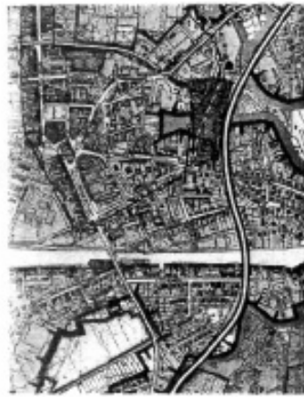
WYRYS ZE STODUM UWARUNKOWAŃ I KIERUNKÓW ZAGOSPODAROWANIA PRZESTRZENNOGO MIASTA CHODZIEŻY 9458 1: 40 000

OZNACZENIA GRAFICZNE granice opracowania planu linie rozgraniczające tereny o różnym przeznaczeniu lub różnych zasadach zagospodarowania granice zgodne z ewidencją / nietytułująca w ewidencji gruntów maksymalne nieprzekraczalne linie zabudowy integralna część nieruchomości PRZEZNACZENIE TERENÓW teren istniejącej zabudowy mieszkaniowej i usług teren usług ogólnomiejskich teren drogi lokalnej teren drogi wewnętrznej